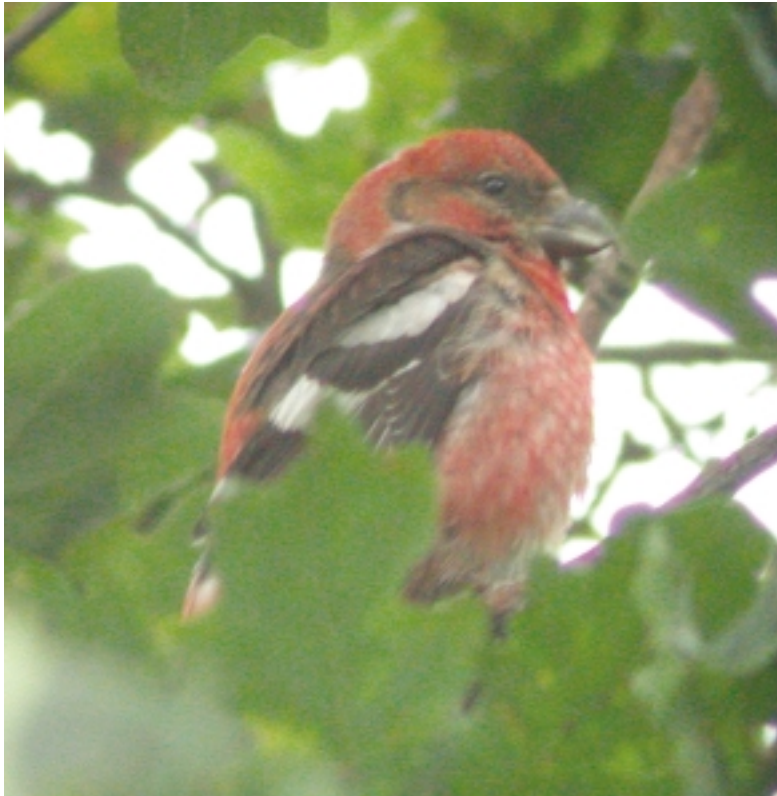
Hvidvinget Korsnæb, han, Saltholm, 10. august 2002 (Ib Jensen). En af de tidlige iagttagelser under efterårets invasion. Bemærk de brede hvide vingebånd, som adskiller arten fra Lille Korsnæb.